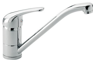
Monomando S1000 - RO 8443 002