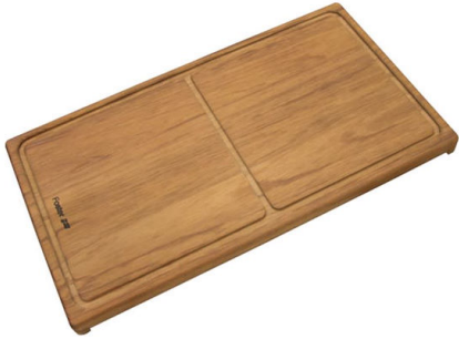
Tabla de corte deslizante de madera Iroko 8643 000