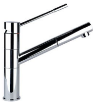
Monomando Lorenzo 8466 000